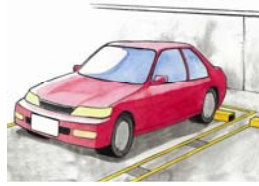
タイムズ駐車場に駐車