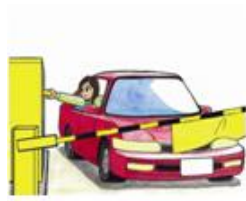
駐車券挿入・「交通ICカード」タッチ