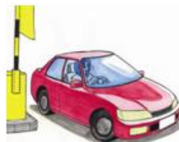
バーが上がれば出庫