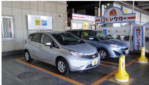
▲ルール&カーシェア新大阪ステーション

【ルール&カーシェア概要】 http://plus.timescar.jp/randc/