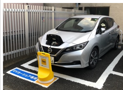
▲EV カーシェアイメージ